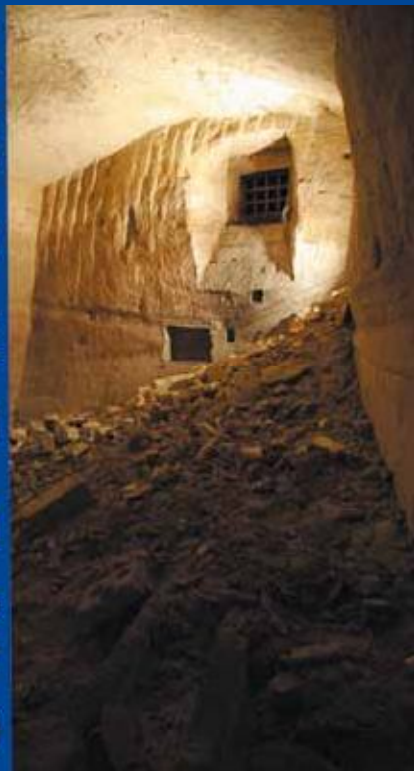
Il marchio del progetto Undergra